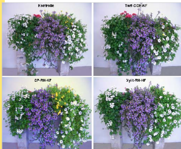
Abbildung 1: Pflanzenentwicklung zu Versuchsende Anfang Oktober

Die Kästen wurden bei Bedarf von Hand mit Leitungswasser (LF 700 µS/cm, 16 °KH, 20 °GH) gegossen. Alle Varianten wurden wöchentlich mit Ferty Mega 3 gedüngt, wobei die verabreichte Nährstoffmenge an die Pflanzenentwicklung angepasst wurde.